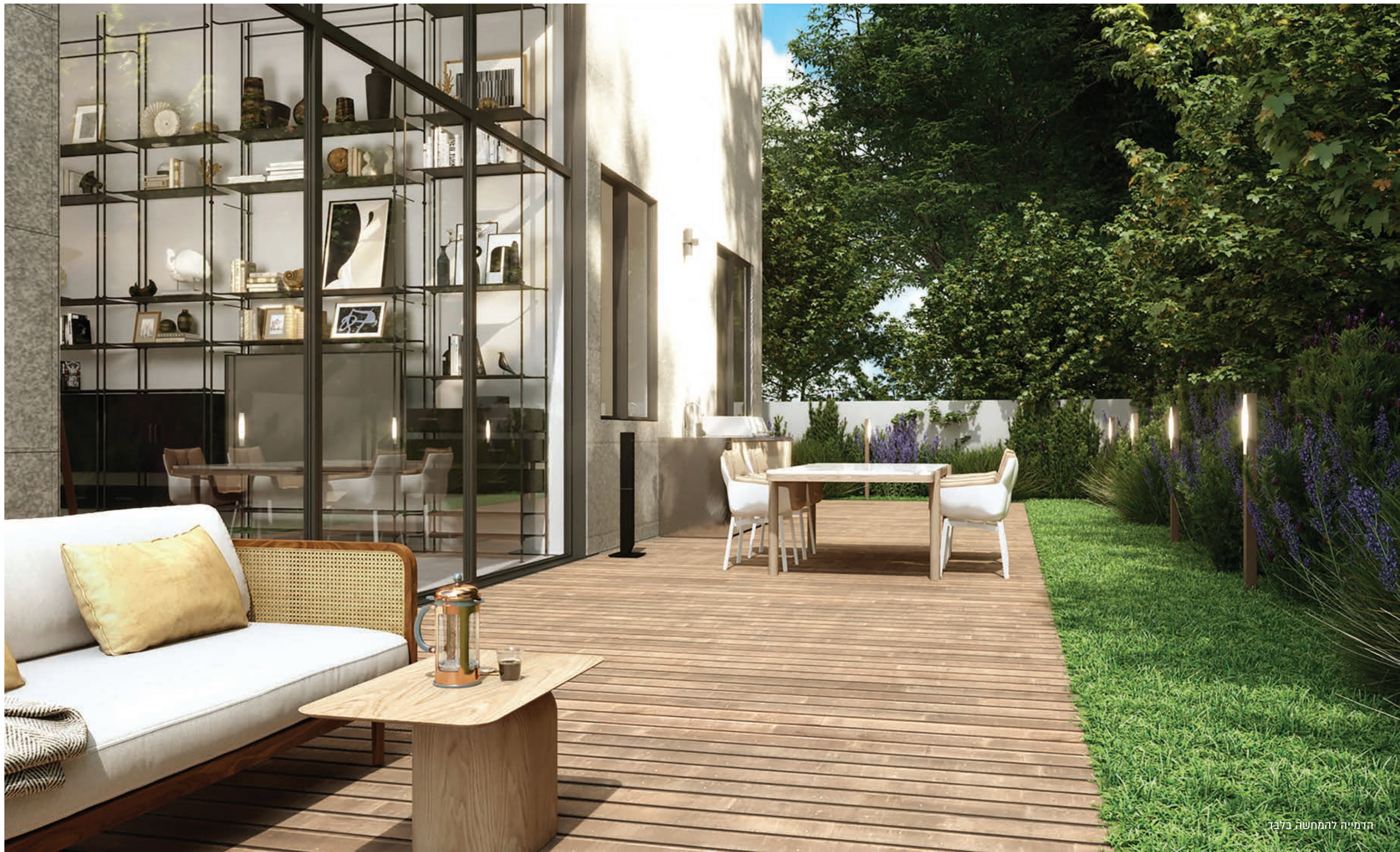
הדמייה להמחשה בלבד