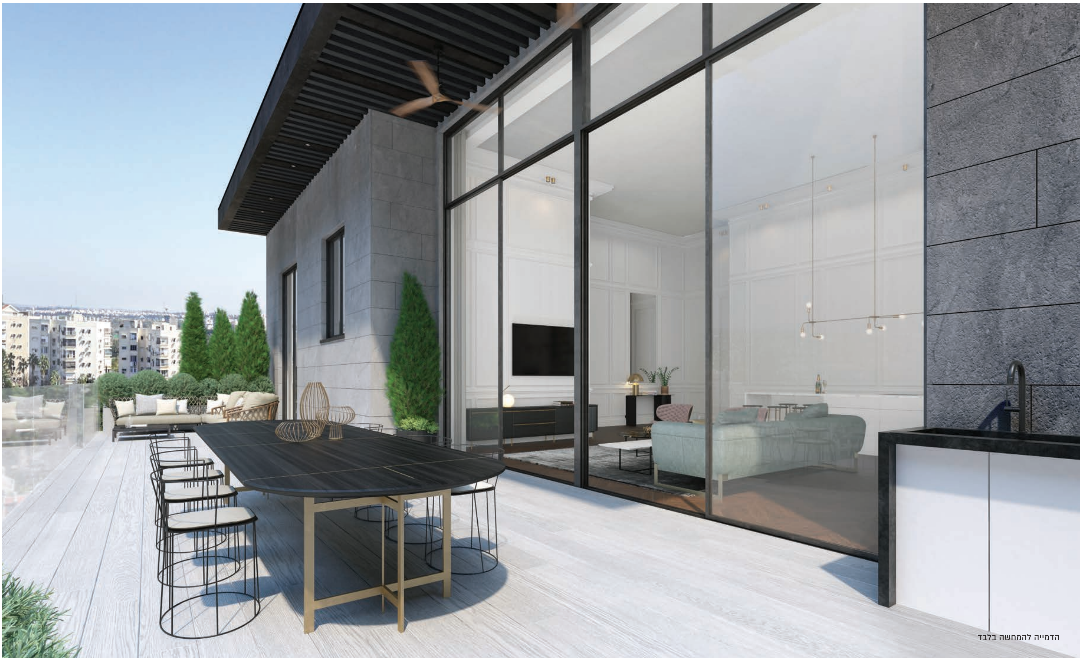
הדמייה להמחשה בלבד