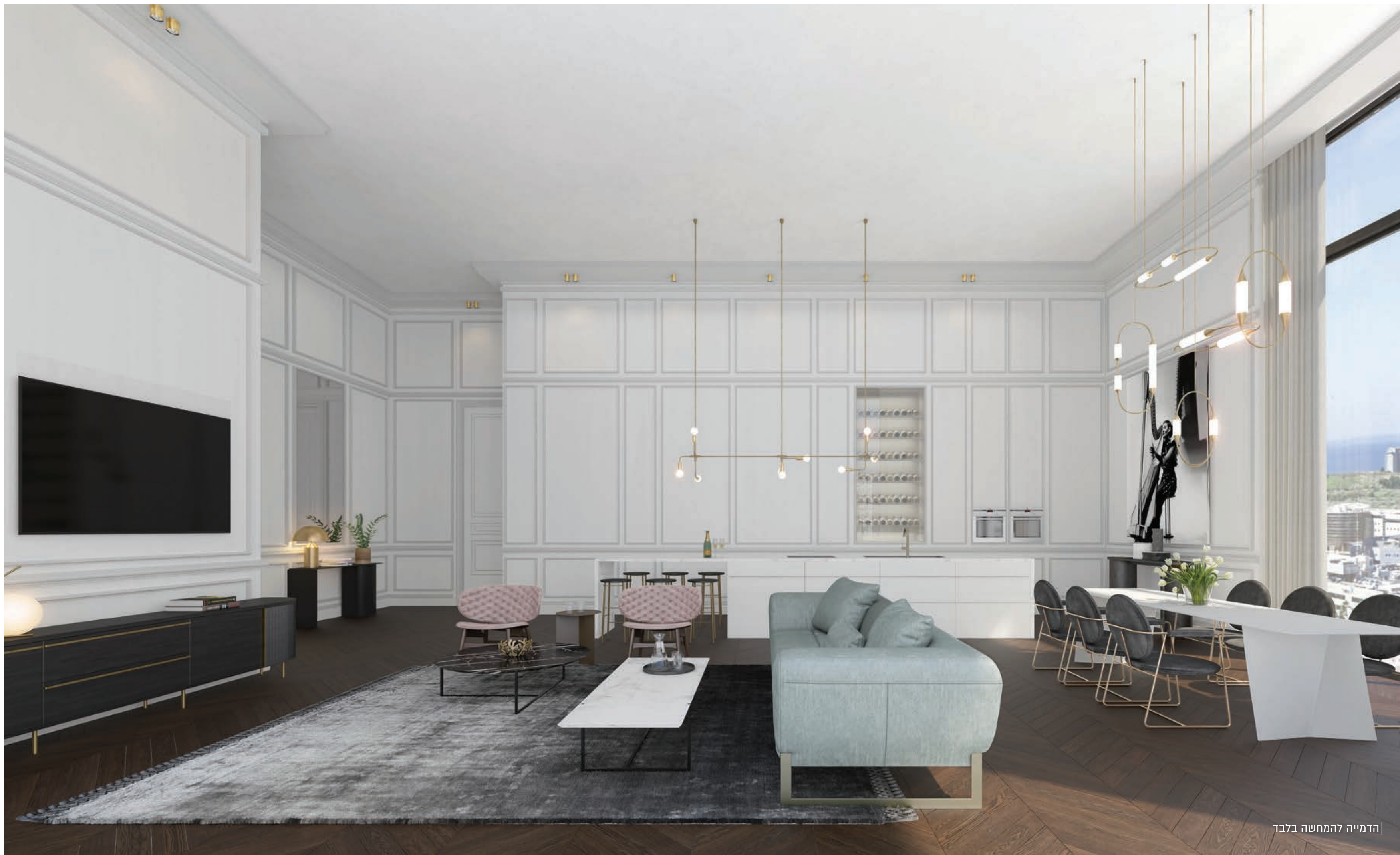
הדמייה להמחשה בלבד