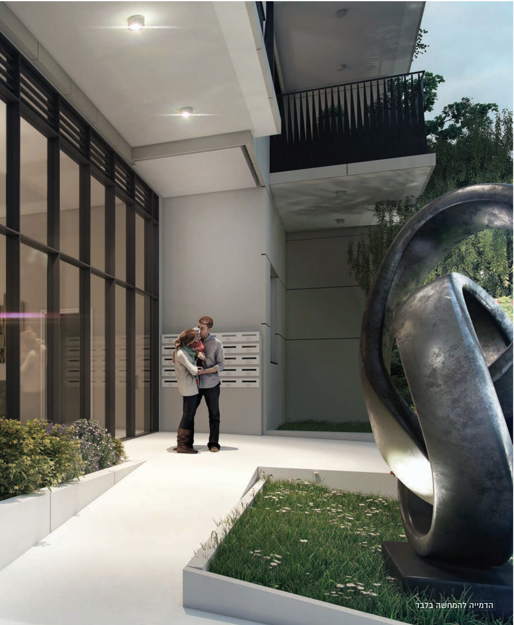
הדמייה להמחשה בלבד