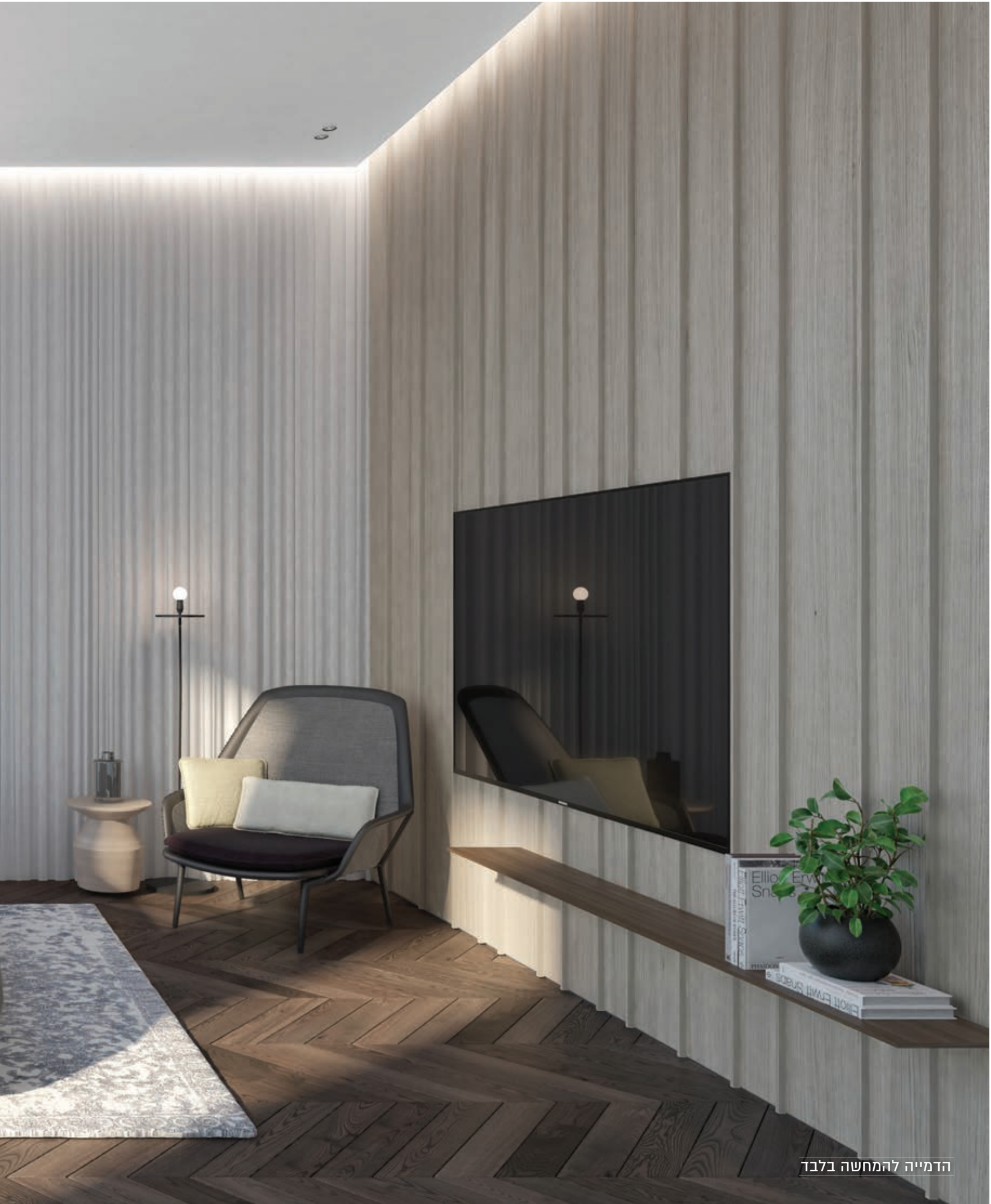
הדמייה להמחשה בלבד

Cooling / Heating: Energy efficient whole apartment hvac ventilation systems.