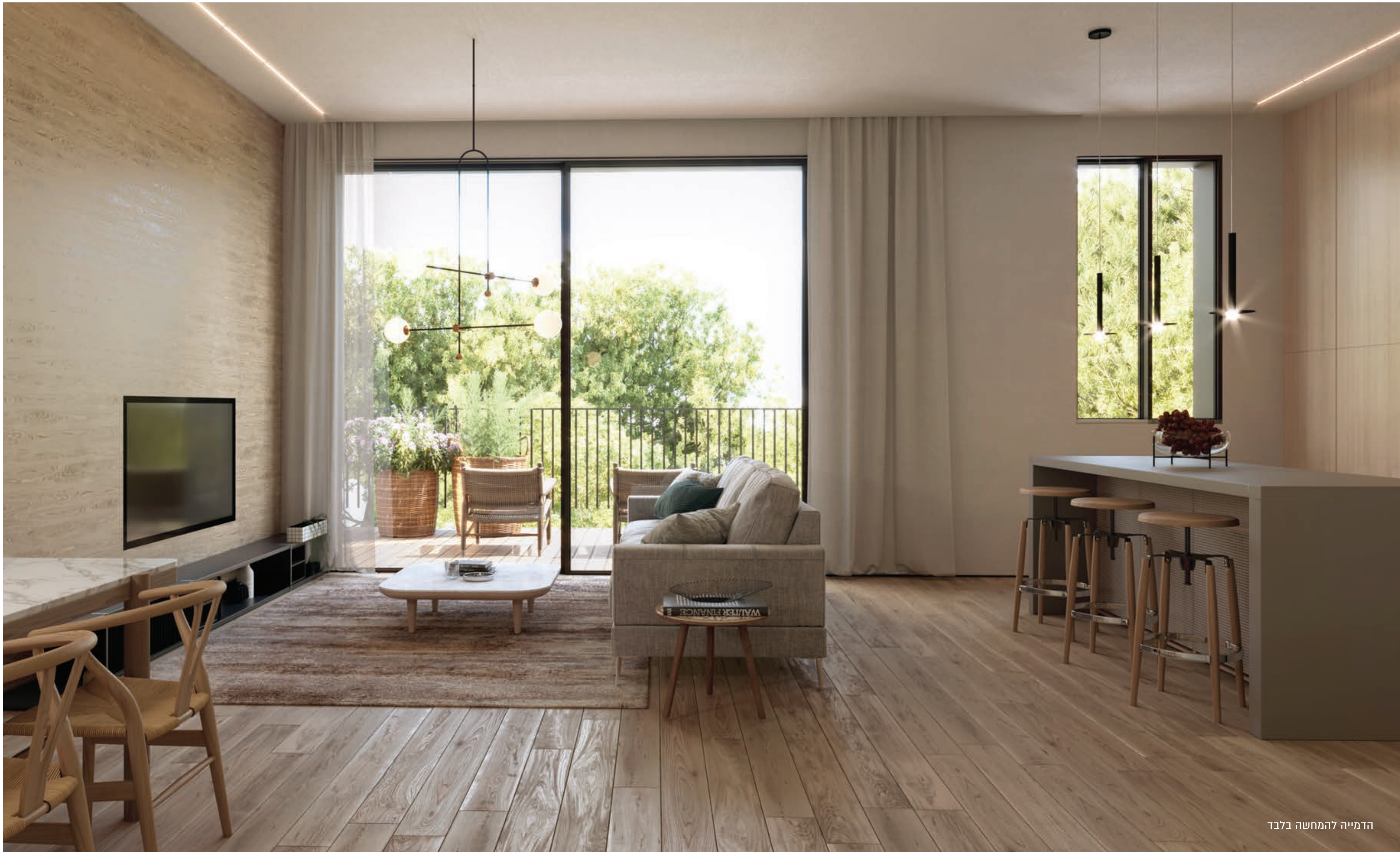
הדמייה להמחשה בלבד