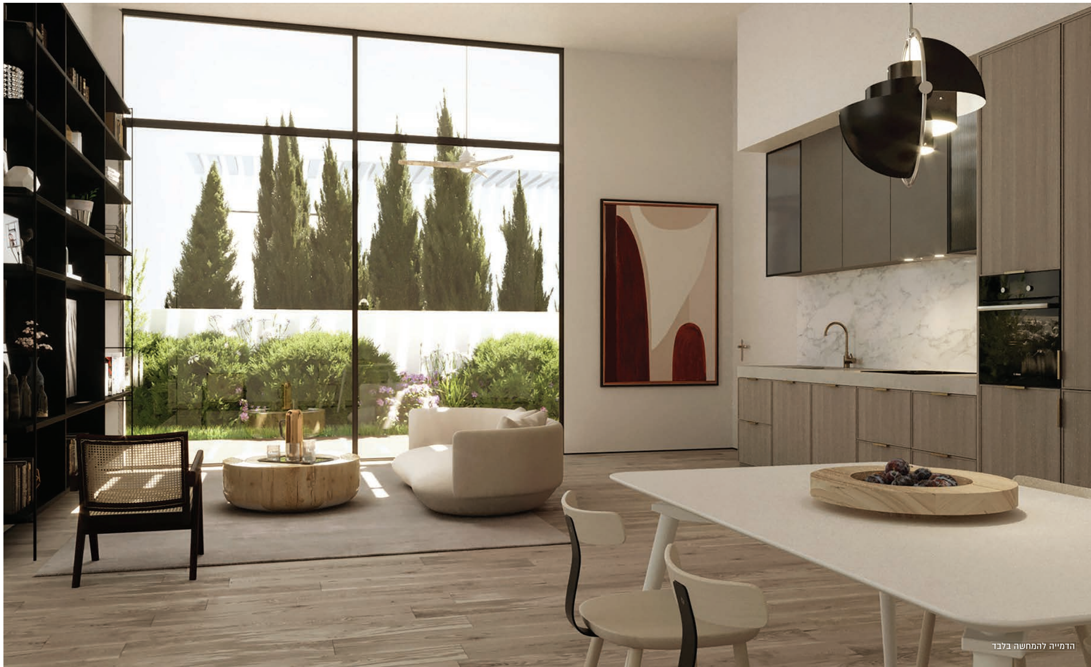
הדמייה להמחשה בלבד