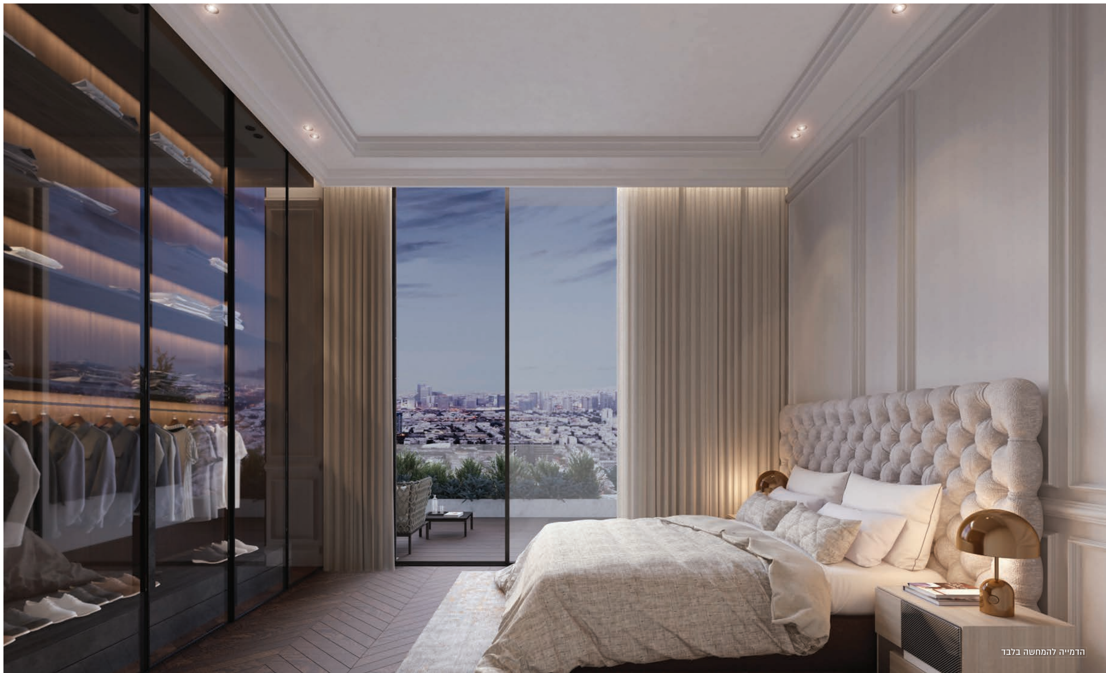
הדמייה להמחשה בלבד