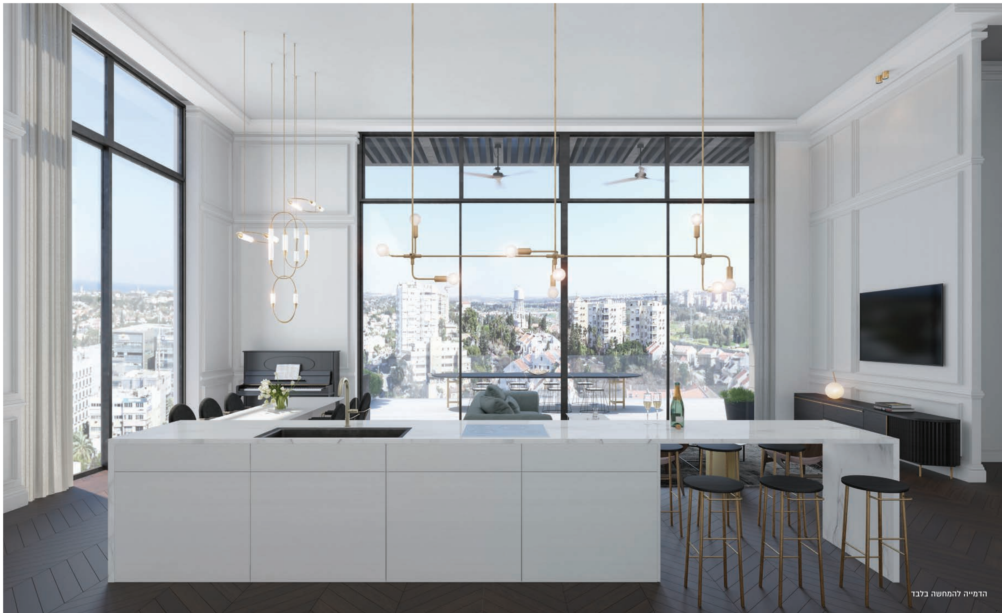
הדמייה להמחשה בלבד