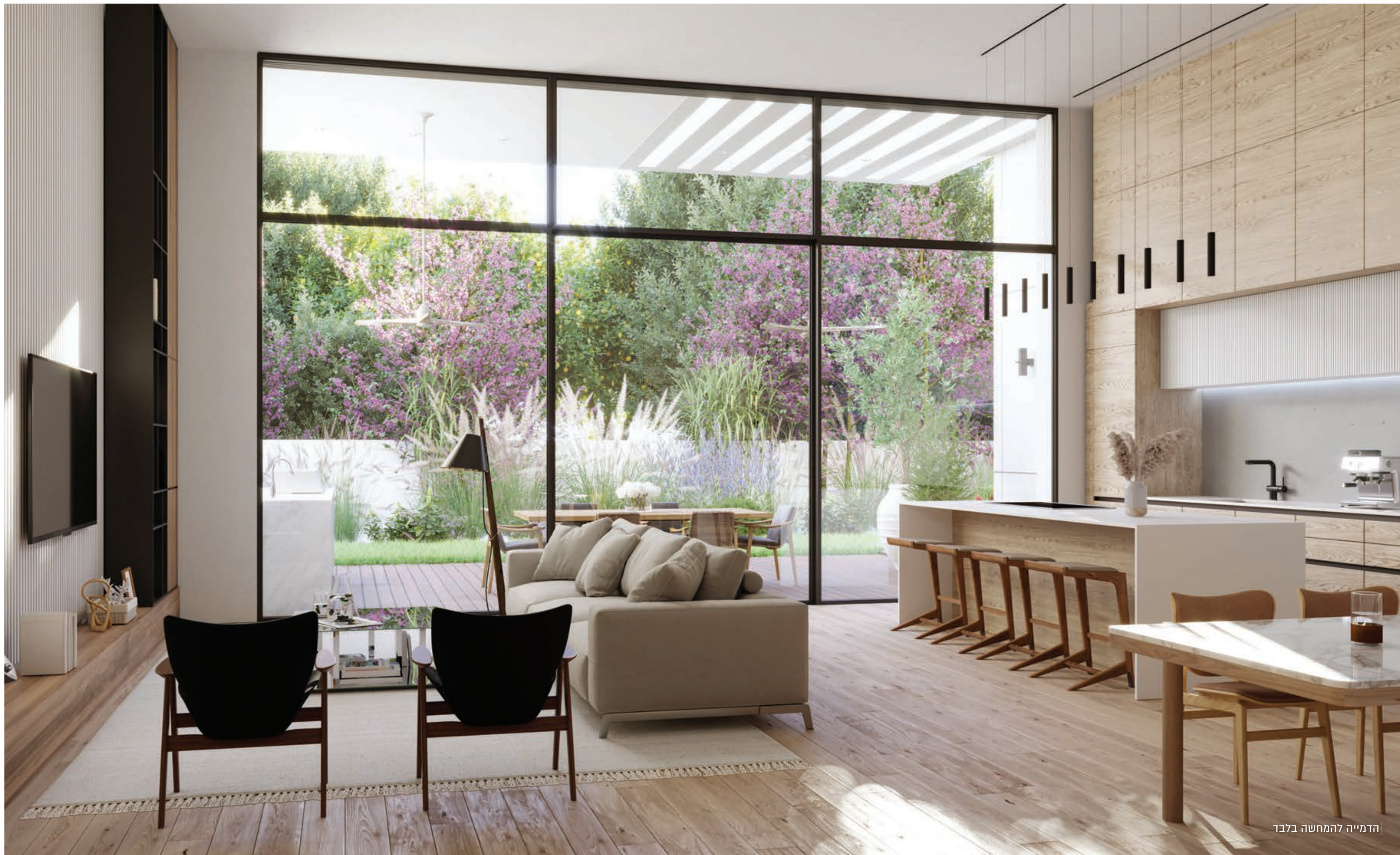
הדמייה להמחשה בלבד