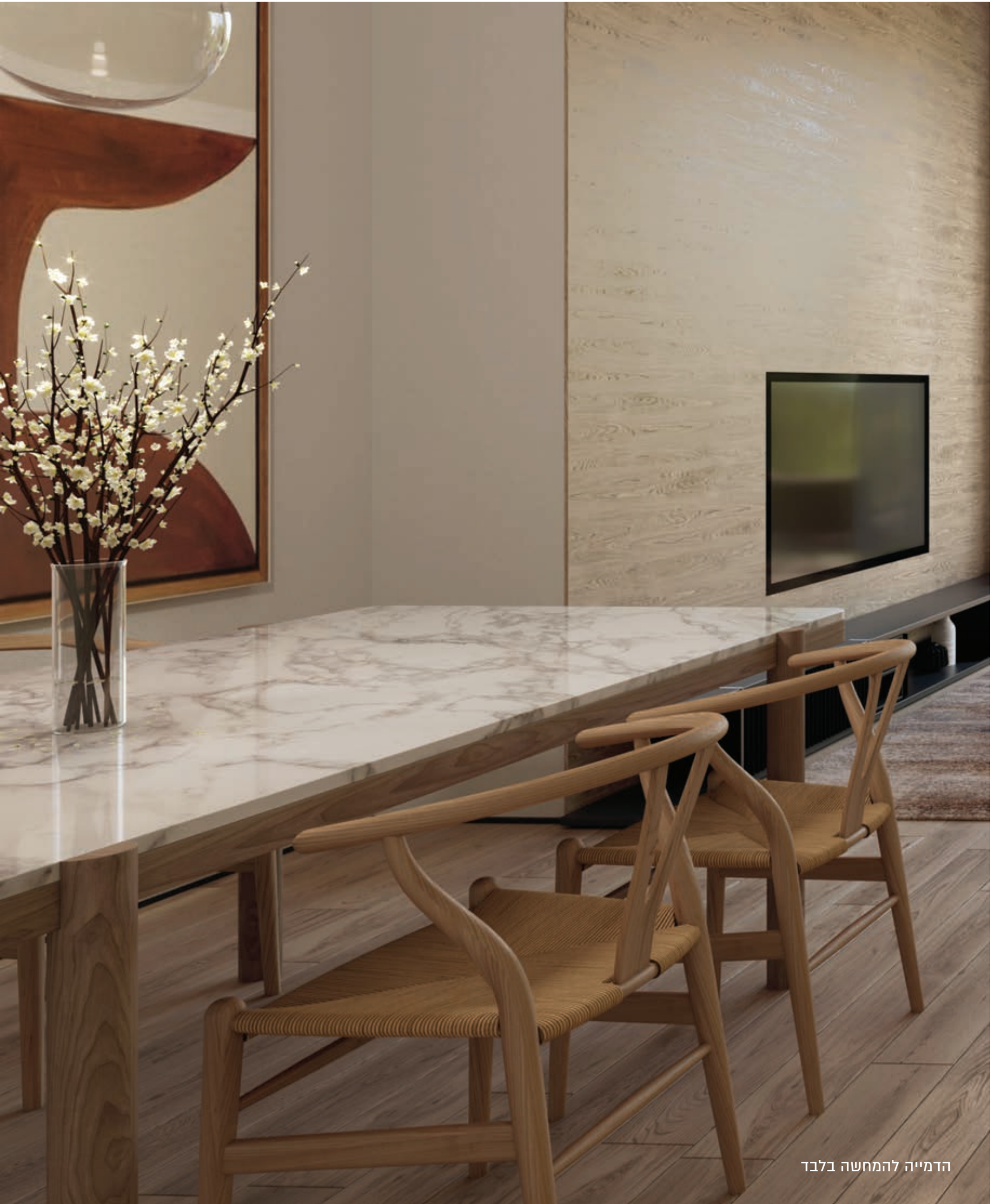
הדמייה להמחשה בלבד