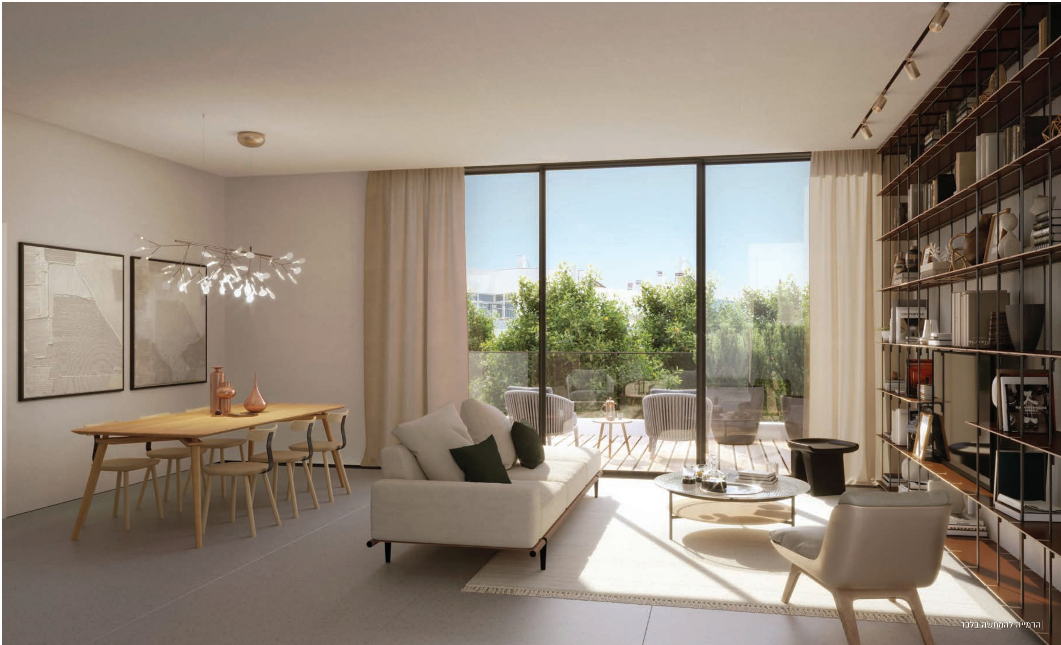
הדמייה להמחשה בלבד