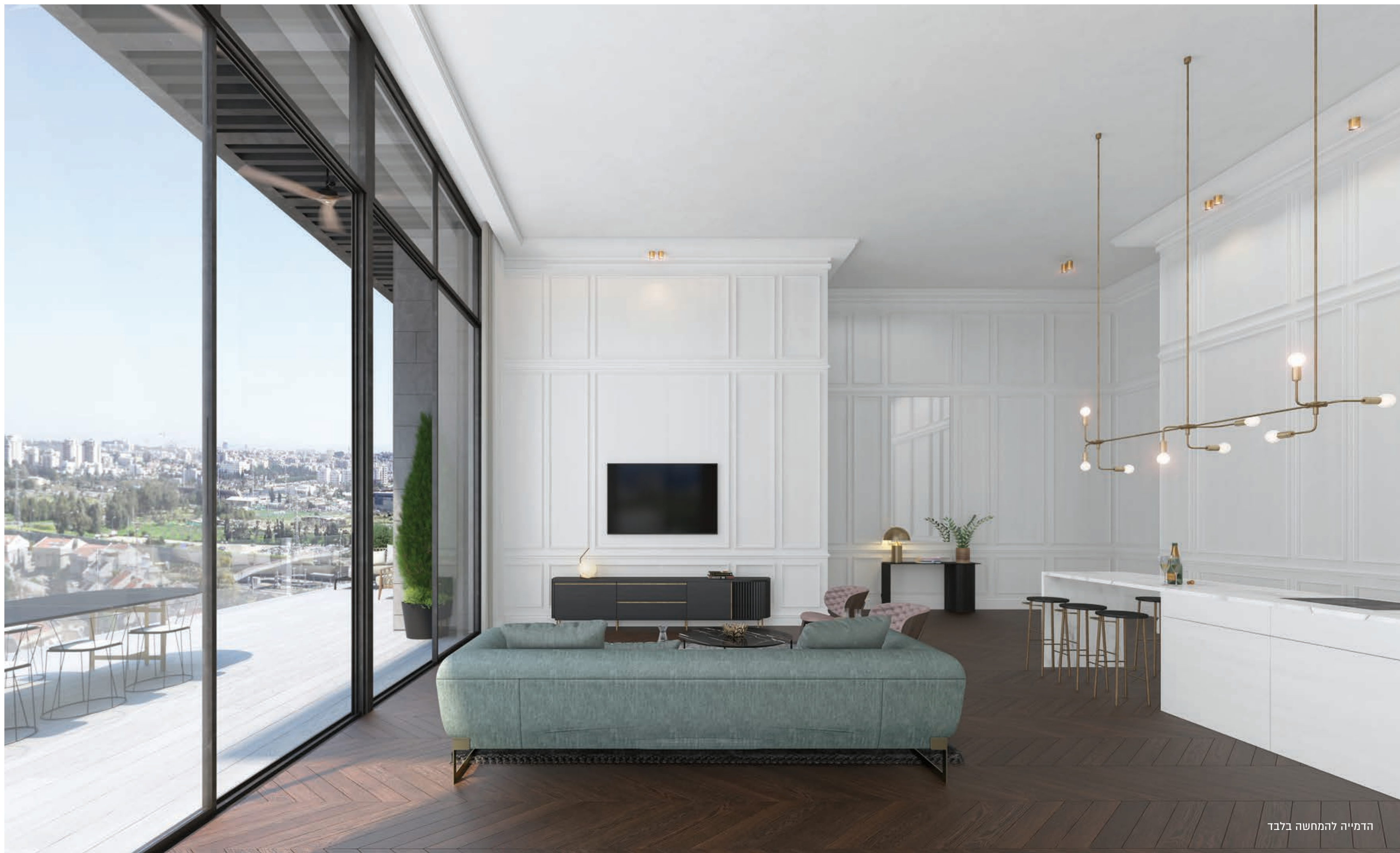
הדמייה להמחשה בלבד