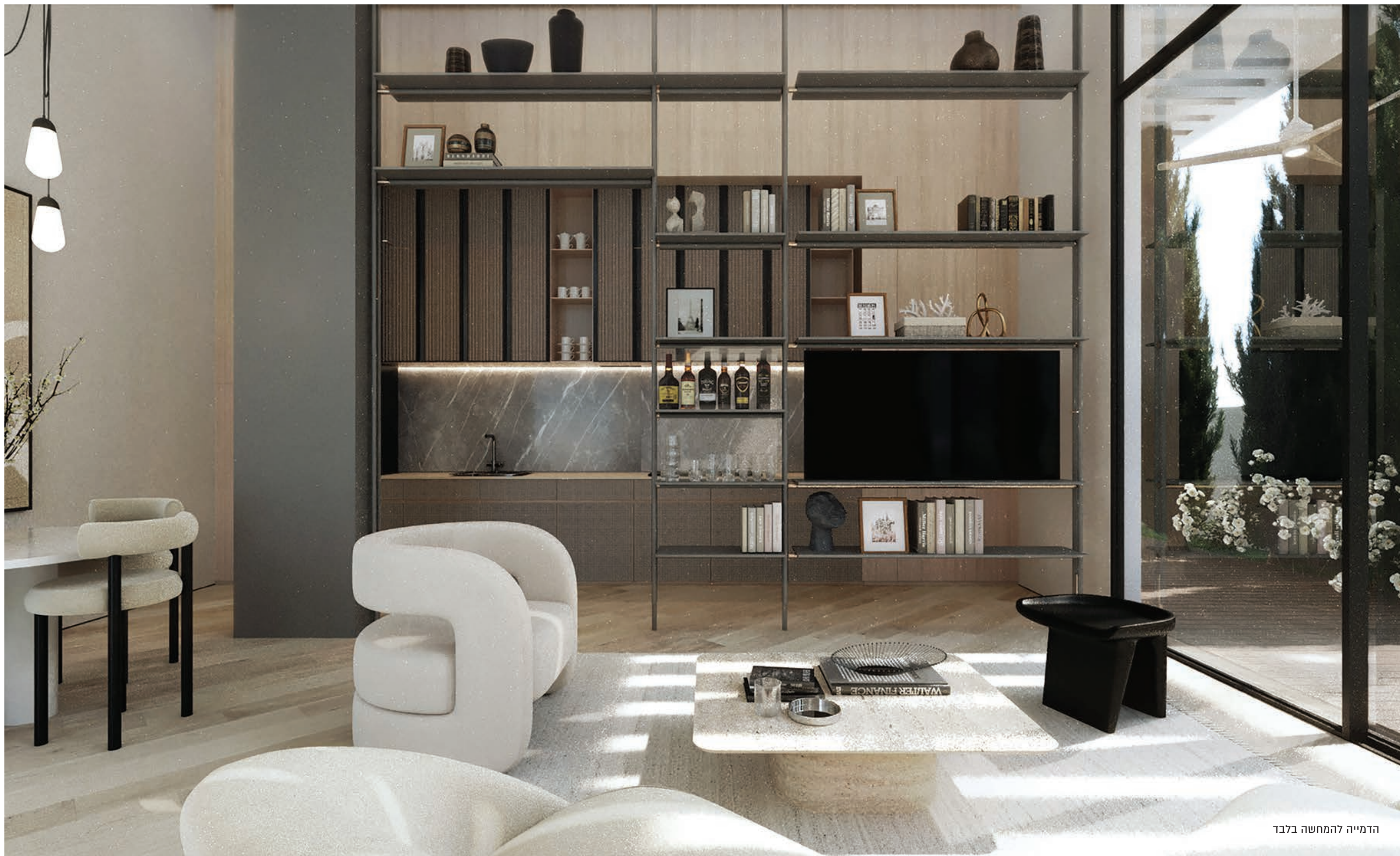
הדמייה להמחשה בלבד