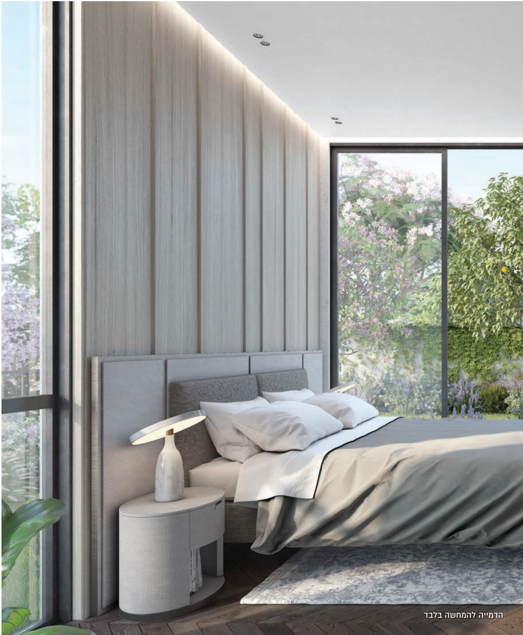
הדמייה להמחשה בלבד