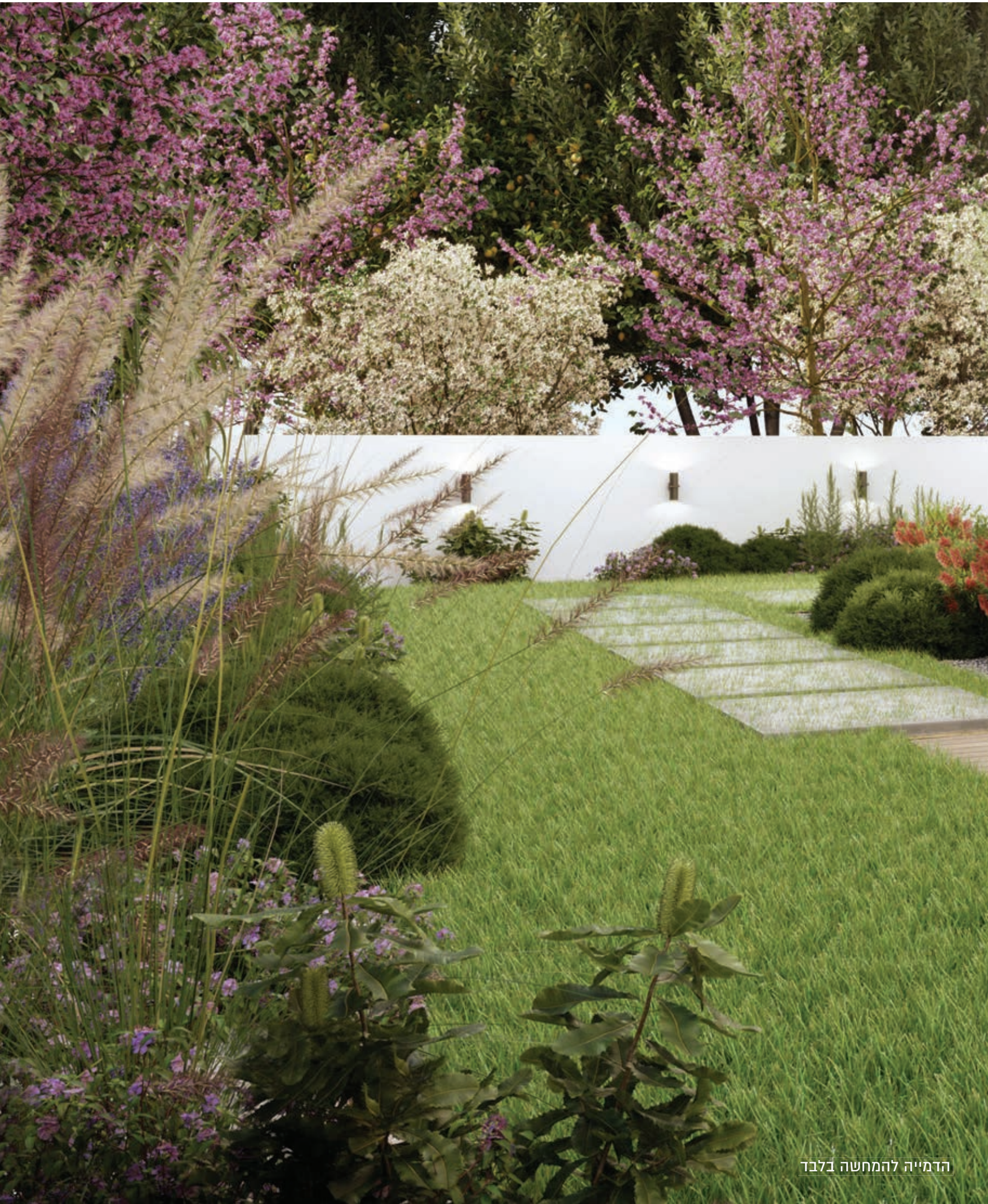
הדמייה להמחשה בלבד

The boundary between home and garden, comfort and discovery, can be exactly what you want it to be. It can be a canvas for horticulture, a space for reading or a setting for a picnic like no other. As the days, weeks and years move through their respective seasonal cycles, the breathtaking views are transformed and the view from your garden to the sky above is always familiar, but never the same.