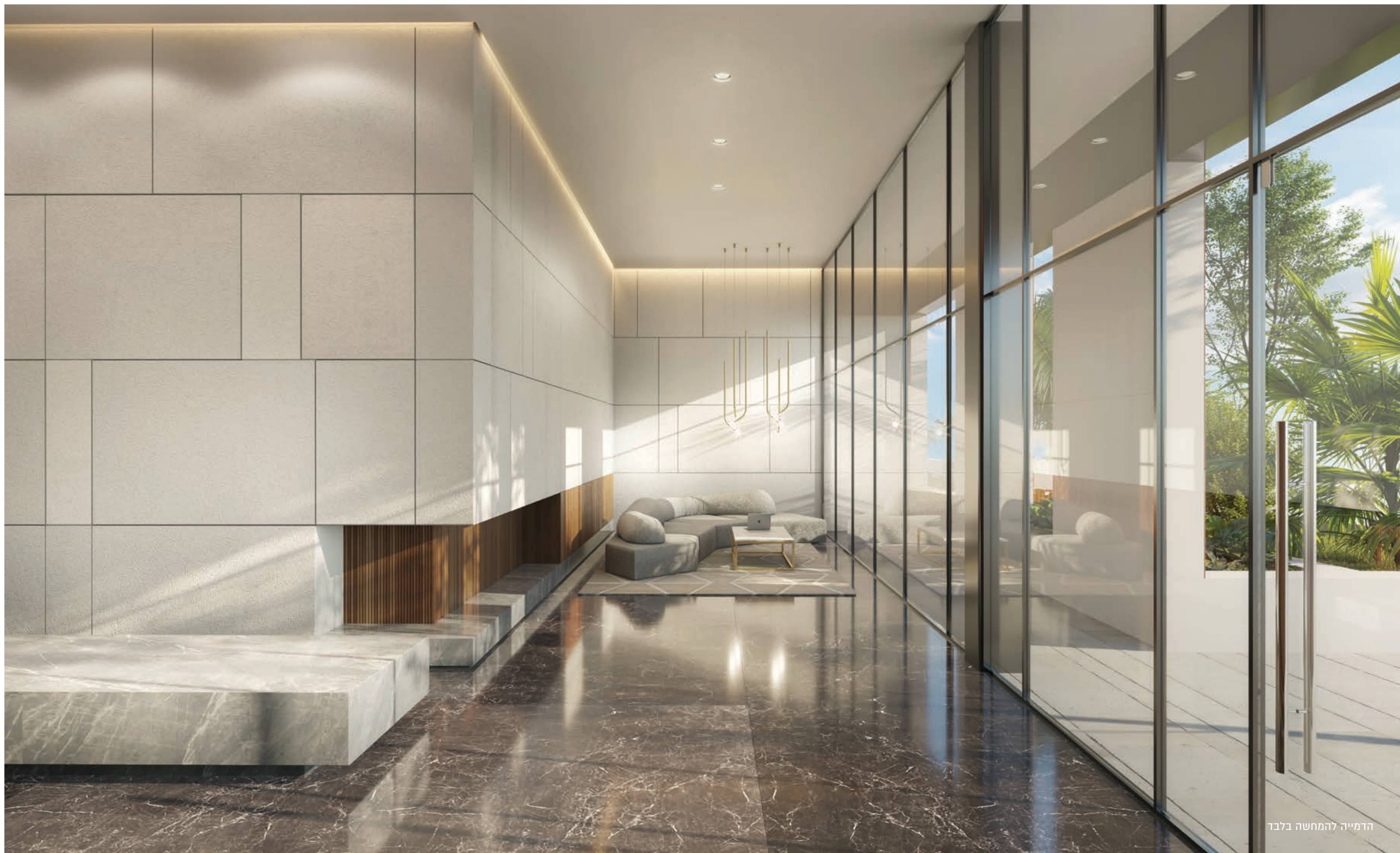
הדמייה להמחשה בלבד